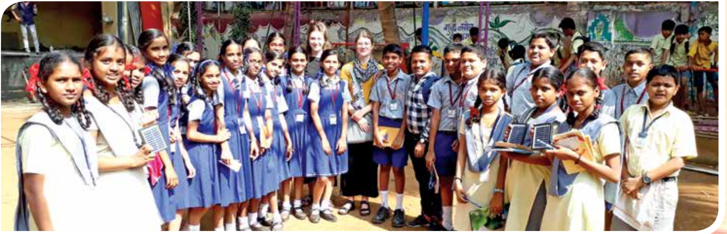
वसुंधरा पर्यावरण संवर्धन विभागाच्या वतीने आयोजित 'सोलर चार्जर कार्यशाळा' मधील सहभागी विद्यार्थी