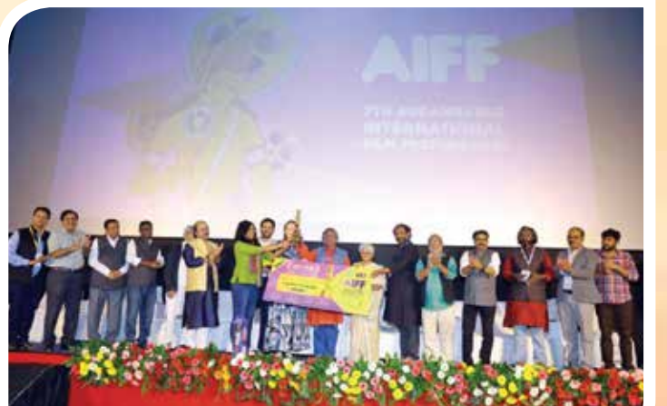
७ वा औरंगाबाद फिल्म फेस्टिवल