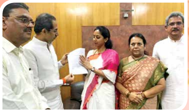
'दिव्यांग हक्क पुनर्वसन प्रणाली सक्षमीकरण कार्यशाळे'चे आयोजन दिनांक ८, ९ व १० नोव्हेंबर २०१९ रोजी करण्यात आले होते.