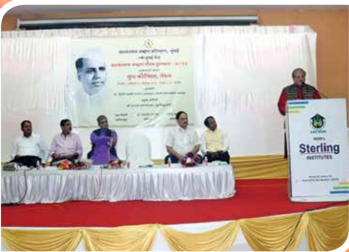
विभागीय केंद्र नवी मुंबईच्या वतीने 'युथ कौन्सिल, नेरळ' या संस्थेस सन २०१९ चा 'यशवंतराव चव्हाण गौरव पुरस्कार' प्रदान करण्यात आला.