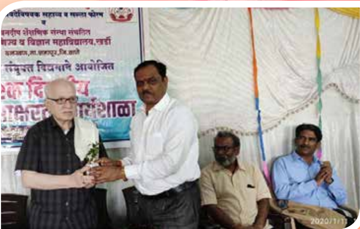
कायदेविषयक साहाय्य जीवनदीप महाविद्यालय, खर्डी आयोजित विधिसाक्षरता कार्यशाळा