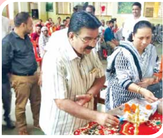
विभागीय केंद्र रत्नागिरी यांच्या वतीने ऐडिप योजनेअंतर्गत दिव्यांग व्यक्तींसाठी मोफत कृत्रीम अवयव आणि साहित्य वाटप शिबिर कार्यक्रमात उपस्थित मान्यवर