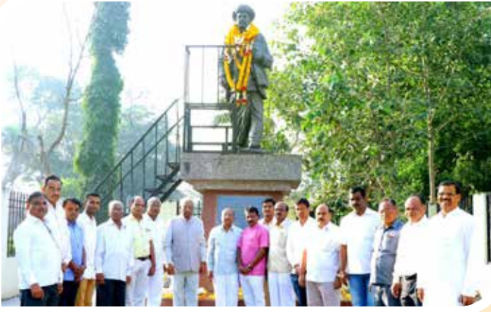
विभागीय केंद्र लातूरच्या वतीने महात्मा जोतिबा फुले पुण्यतिथीनिमित्त महात्मा फुले यांच्या पुतळ्याला पुष्पहार अर्पण करून अभिवादन