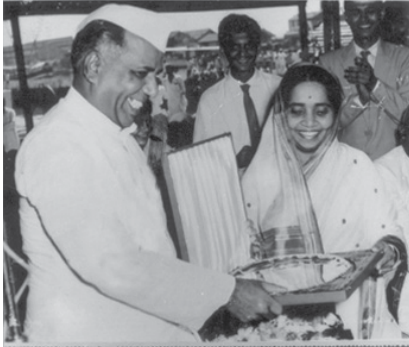
सन्मानपत्र स्वीकारताना पत्नीसमवेत हास्यमुद्रा