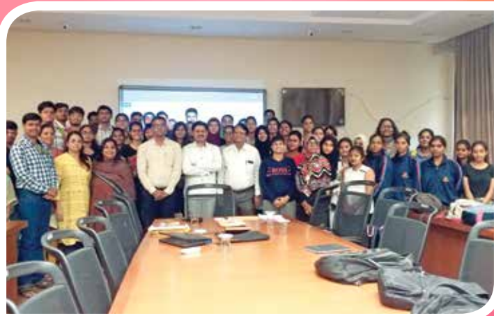
विभागीय केंद्र ठाणेच्या वतीने सोमय्या कॉलेजमध्ये विद्यार्थ्यांना स्पर्धा परीक्षेबाबत मार्गदर्शन