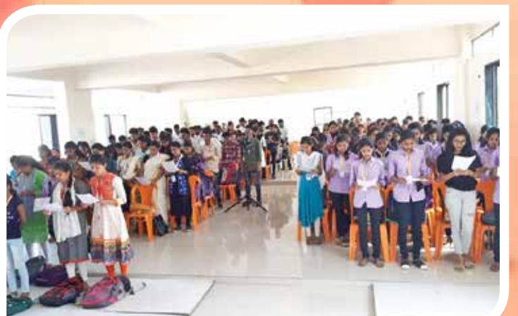
कायदेविषयक साहाय्य विभाग जीवनदीप महाविद्यालय गोवेली विधिसाक्षरता कार्यशाळेस उपस्थित विद्यार्थी