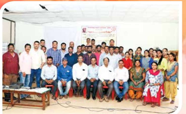
विभागीय केंद्र ठाणेच्या वतीने महाराष्ट्र राज्य विद्युत वितरणाच्या अधिकारी व कर्मचाऱ्यांना ताण-तणाव व्यवस्थापन मार्गदर्शन शिबिर