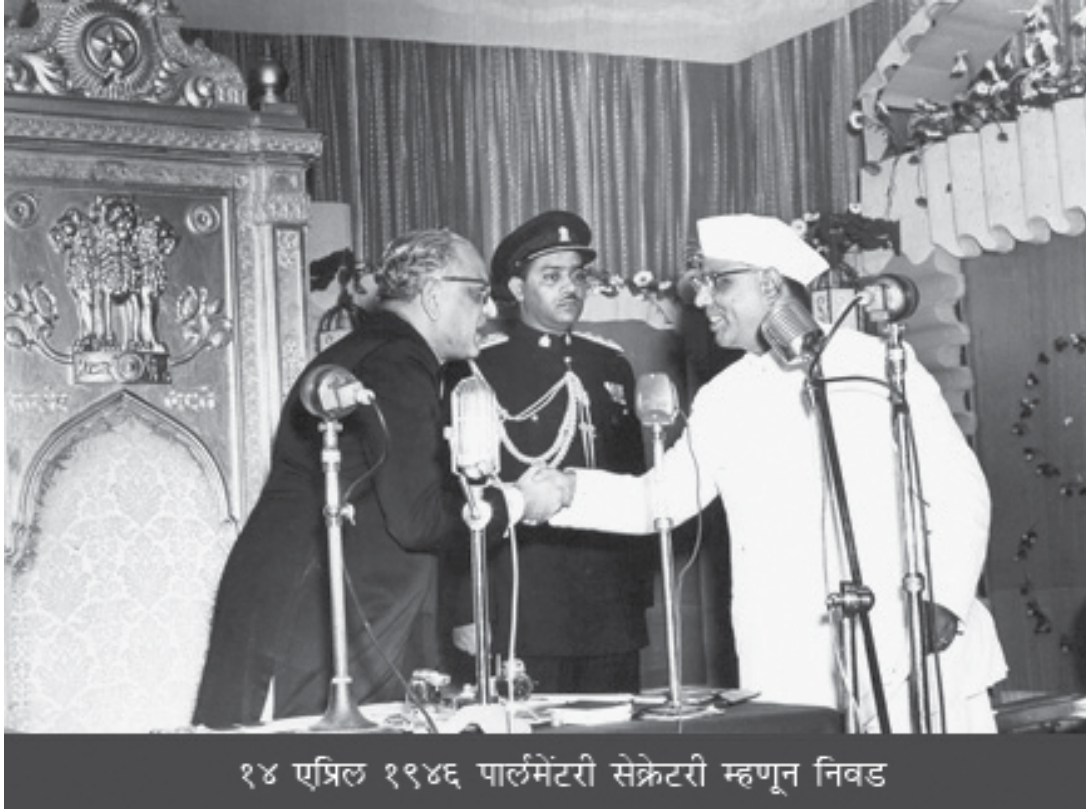
१४ एप्रिल १९४६ पार्लमेंटरी सेक्रेटरी म्हणून निवड