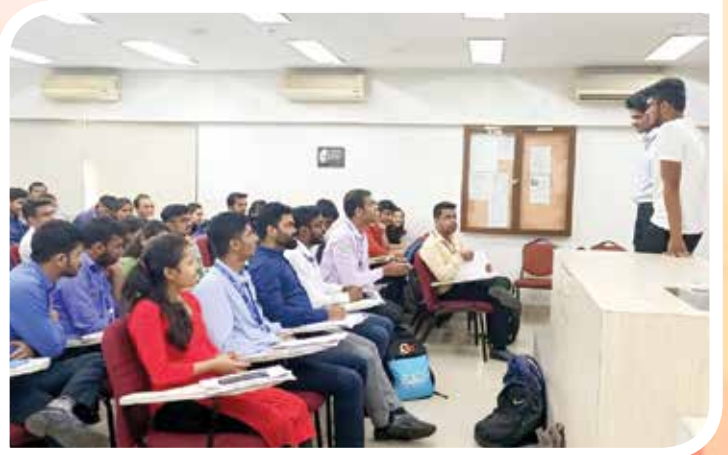
पीजी डॅक ऑगस्ट २०१९ च्या तुकडीतील विद्यार्थी