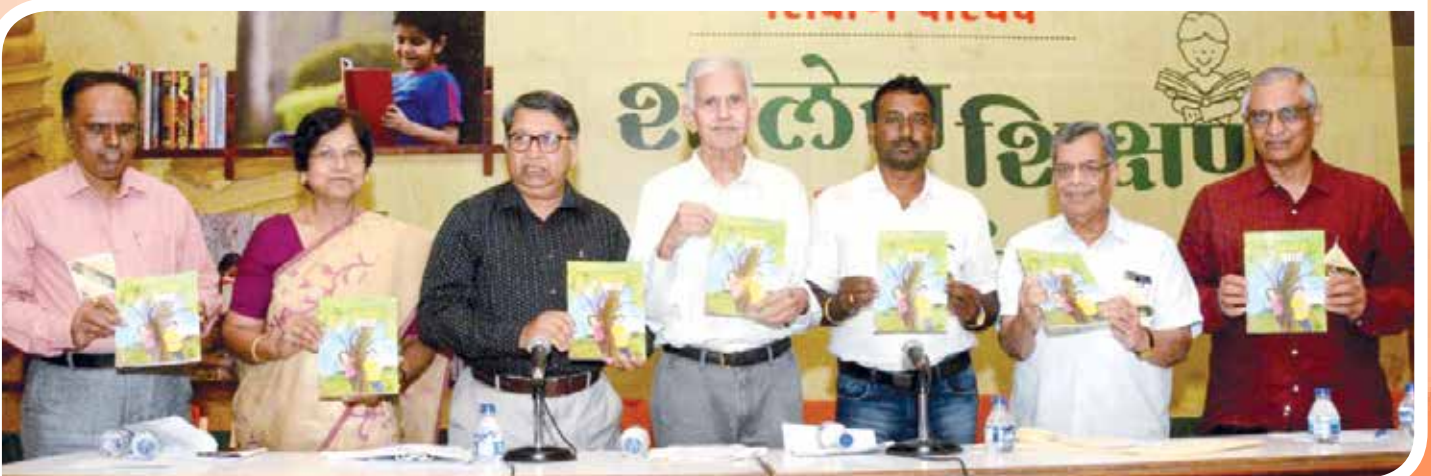
शिक्षण विकास मंच आयोजित जिल्हा परिषद शाळा खर्डी, तालुका सेलू येथील शालेय विद्यार्थ्यांनी अनुवादित केलेल्या 'आनंददेरो झाड' या पुस्तकाचे प्रकाशन