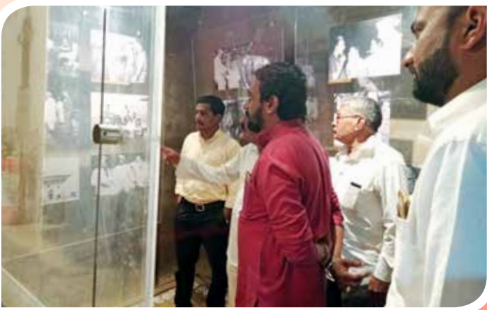
मा.यशवंतराव चव्हाण यांचे देवराष्ट्रे येथील जन्मघर स्मारकास भेट देणारे पाहुणे तसेच अभ्यासक