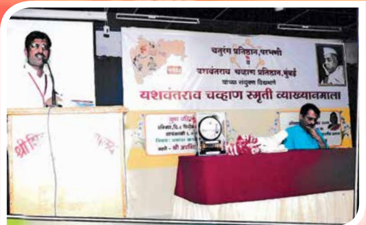
विभागीय केंद्र, परभणी आयोजित यशवंतराव चव्हाण स्मृती व्याख्यानमाला