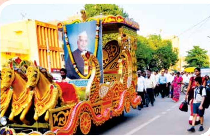
विभागीय केंद्र कराडच्या वतीने आयोजित मा.यशवंतराव चव्हाण यांचा ३५ वा पुण्यतिथी कार्यक्रम. यावेळी उपस्थित मा. कल्लाप्पाणा आवाडे व इतर मान्यवर