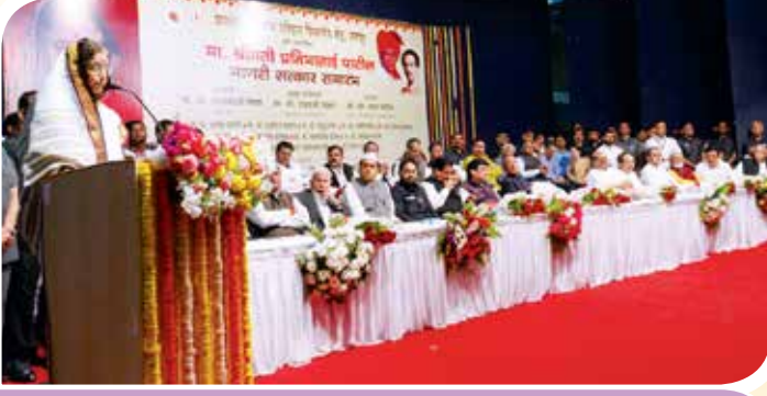
विभागीय केंद्र नागपूर आयोजित मा. श्रीमती प्रतिभाताई पाटील यांच्या सत्कारप्रसंगी मनोगत व्यक्त करताना श्रीमती पाटील व मंचावर उपस्थित मान्यवर