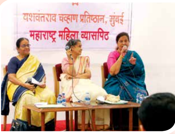
महाराष्ट्र महिला व्यासपीठ आयोजित ज्येष्ठ साहित्यिक वीणाताई गवाणकर मुलाखत