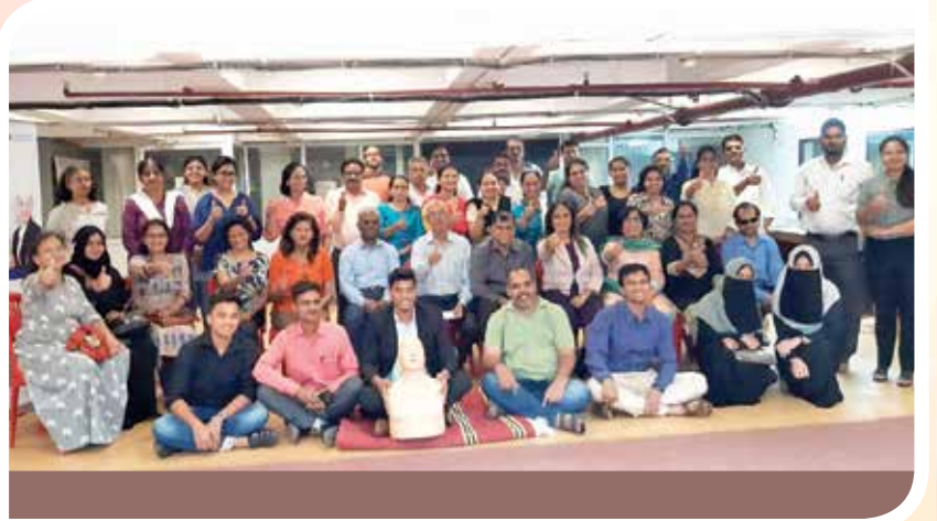
महाराष्ट्र महिला व्यासपीठ आयोजित फर्स्ट एड, पी.सी.आर ट्रेनिंग प्रोग्राम